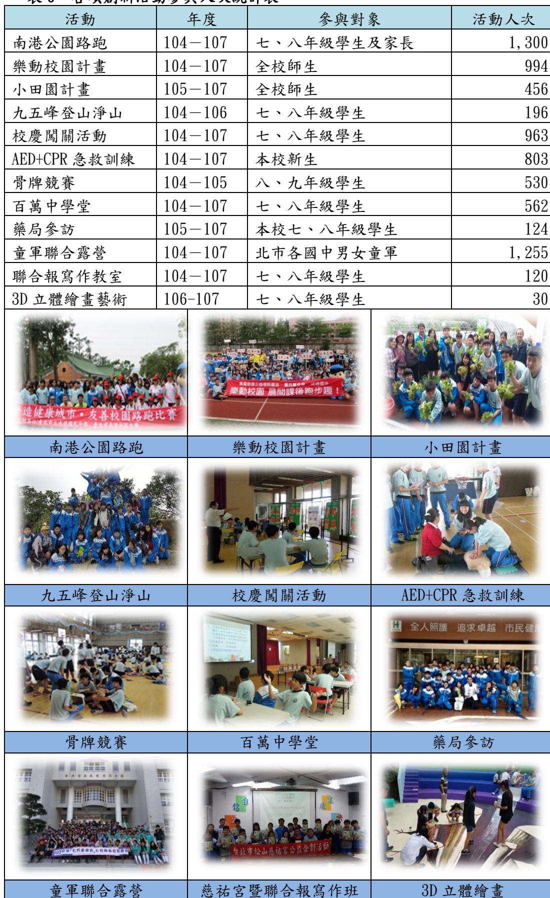
表 6 各項創新活動參與人次統計表