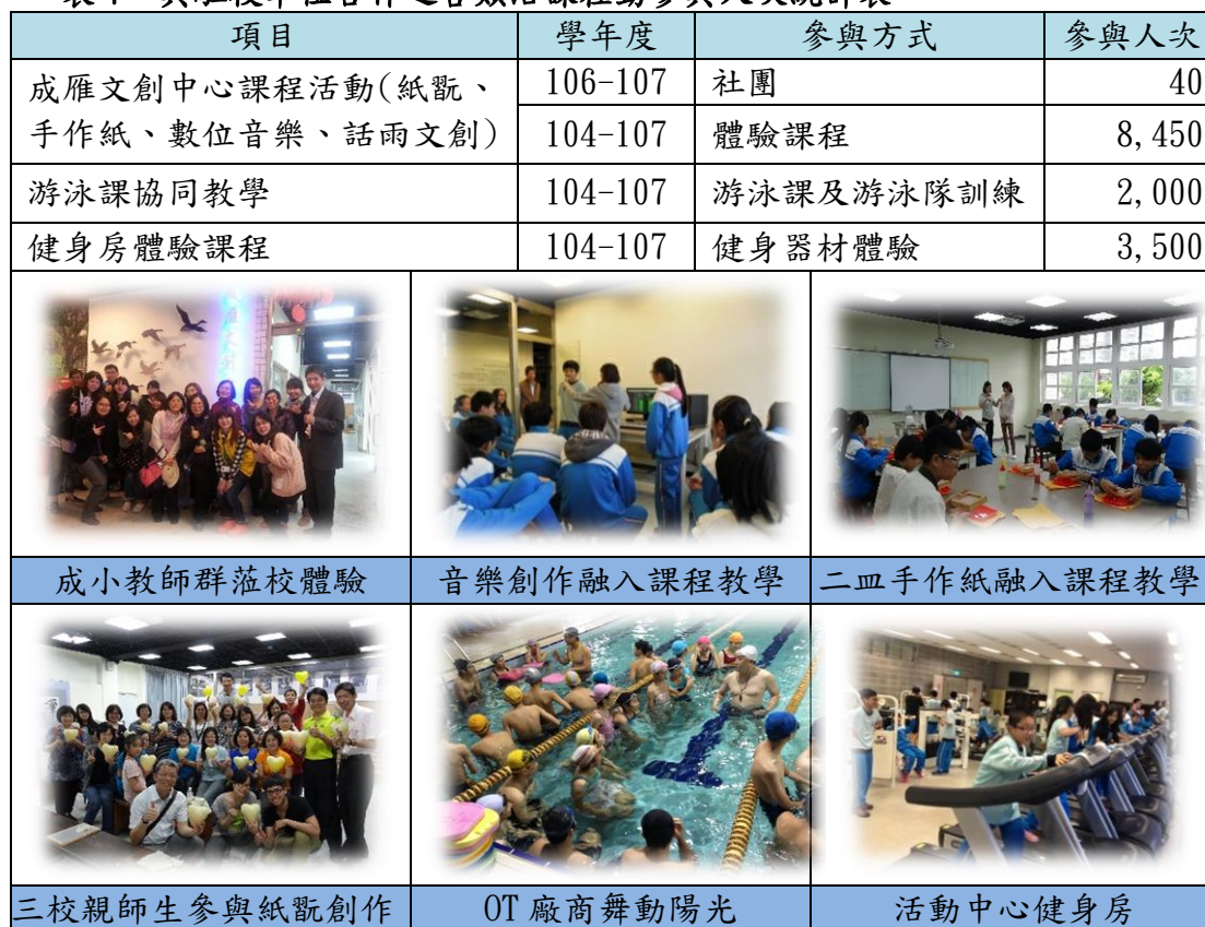
表 7 與駐校單位合作之各類活課程動參與人次統計表