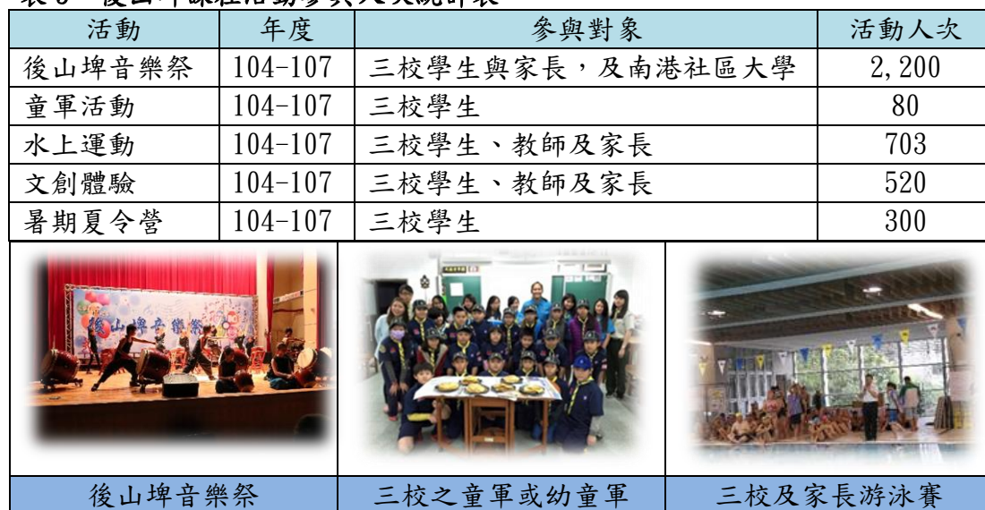
表 5 後山埤課程活動參與人次統計表